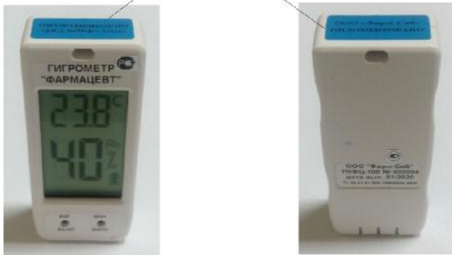
Рисунок 2 – Общий вид гигрометра «Фармацевт» модели ТМФЦ-100 (режим отображения относительной влажности и температуры)