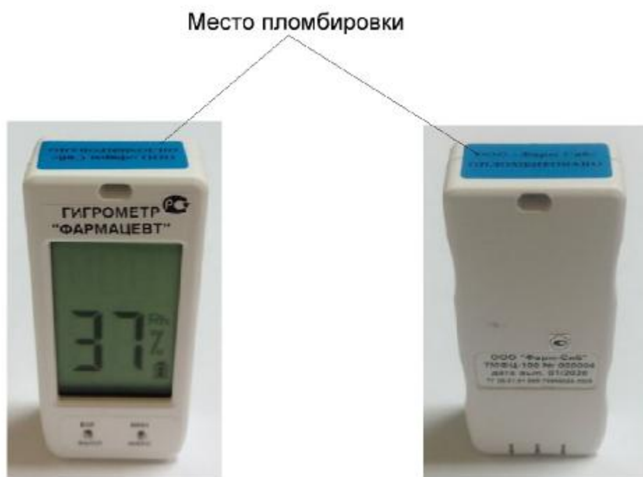
Рисунок 1 – Общий вид гигрометра «Фармацевт» модели ТМФЦ-100

Общие виды гигрометров с указанием места пломбировки представлены на рисунках 1 - 4.